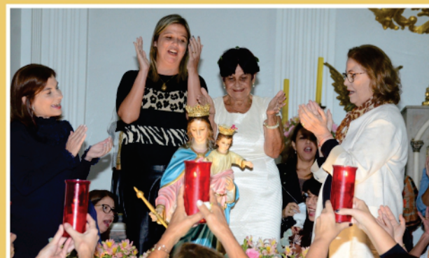
6º DIA: EX-ALUNOS