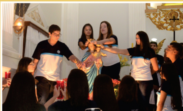
2º DIA: 9º ANO FUND. E 1º E 2º ENSINO MÉDIO