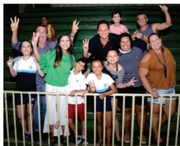
A torcida dos pais dando uma super força

Ansiosamente aguardado pelos alunos do 6º ao 9º ano do Fundamental, a 18ª edição dos Jogos de Outono aconteceu entre os dias 8 e 15 de abril, movimentando o complexo esportivo da escola, apresentando modalidades, incentivando o esporte, descobrindo talentos e promovendo a interação entre os alunos.