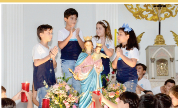
8º DIA 2º E 3º ANOS FUNDAMENTAL