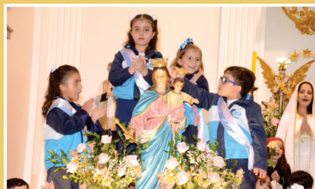
9º DIA: ESCOLA INFANTIL