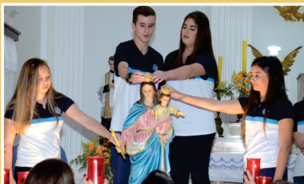
4º DIA: 3º ANO ENSINO MÉDIO